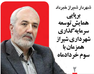
شهردار شیراز خبردار برپایی همایش توسعه سرمایه گذاری شهرداری شیراز همزمان با سوم خردادماه