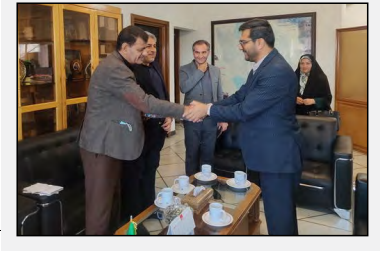
معاون هماهنگی امور رانرین و گردشگری استانداری فارس گفت: گردشگری سلامت و تأمین خدمات مورد نیاز به گردشگران عراقی خرد بود در گزارش ایلمه محسن رانی در نخستین جلسه شورای هماهنگی بانک‌های استان فارس با اشاره به رشد سال افزوده همه فعالیت‌های اقتصادی باید همسو با شمار بالا باشد. ی‌اشدوی گفت: بانک‌ها باید بر اساس چهار ترم و رشد

استاندار فارس با اشاره به نقش موثر جهاد کشاورزی در حذف واسطه‌ها و رساندن محصولات با قیمت کمتر به مردم، گفت: این اقدام در راستای کمک به معیشت مردم انجام می‌شود.