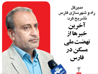
مدیرکل راه و شهرسازی فارس تشریح کرد: آخرین خبرها از نهضت ملی مسکن در فارس