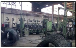
بند ب تهرمه ماده ۱۶ که گروه رف معادن تولید برزیر و دیگر این تسهیلات را دریافت کنند این واحدها به طور کامل از کد خارج خواهند شد. تسهیلاتی که تاکنون تسویه نشده و تسهیلاتی که در حال بازگرداندن به بانک قرارگرفته اند به صورت تسهیلات راکد در نظر گرفته شده اند.

معاون صنایع سازمان صنایع استان فارس با بیان این که یکی از دغدغه‌های مهم صنایع استان فارس واحدهای راکد در کشور است، گفت: با دستور استاندار قرارگاه بررسی وضعیت این واحدها با مدیریت معاون صنایع استان فارس تشکیل می‌شود. تمامی دستگاه‌های متولی موظف شدند واحدهای راکد را بر اساس موجودی اقلام باقیمانده در واحدها اعلام کنند. قرارگاه واحدهای راکد در استان فارس در روز ۲۲ خرداد ۱۴۰۲ با حضور استاندار فارس و معاون صنایع استان فارس تشکیل شد. قرارگاه واحدهای راکد در استان فارس در روز ۲۲ خرداد ۱۴۰۲ با حضور استاندار فارس و معاون صنایع استان فارس تشکیل شد.