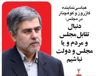
عباسی نماینده کازرون و کوهمانار در مجلس: دنبال تقابل مجلس و مردم و یا مجلس و دولت نباشیم