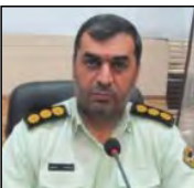
فرمانده انتظامی لارستان گفت: شرکت هرمی بلم با ۸۰ میلیارد ریال کالهدرداری در لارستان شناسایی و سپس منهدم شد.