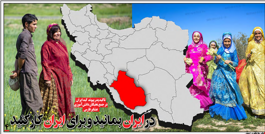
در ایران بمانید و برای ایران کار کنید تاکید بدر پیوند کند ایران در جمع نخبگان دانش آموزی مشاور فارس

قطع دست واسطه‌ها در حوزه کشاورزی راهکار دستوری استاندار فارس برای بهبود معیشت مردم و رساندن محصولات کشاورزی با قیمت کمتر به اهالی استان