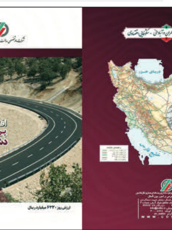
نقشه پروژه باند دوم بزرگراه دشت ارژن - ابوالحیات

است باقی مانده این پروژه هر چه سریعتر اقدام داریم و تا پایان سال به دو میلیون واحد می‌رسیم.