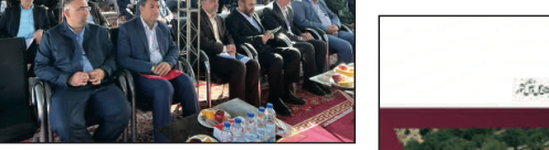
رستم قاسمی وزیر راه و شهرسازی

مقدم وزیر راه و شهرسازی و مدیرعامل شرکت ساخت و توسعه زیربناهای حمل و نقل کشور نیز در ادامه این مراسم گفت: در حال حاضر حدود ۱۴ پروژه به فضا، چهارم به لار، چهارم به چهرم، محور قدیم فسا به داراب، زرقان به قلات خان و زینان، زین دشت به دولت آباد، کارزون به حاجی آباد و دالین به نورآباد را از جمله آنها ذکر و خاطرنشان کرد که تا پایان اسفند به بهره‌برداری می‌رسند.