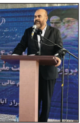
رستم قاسمی وزیر راه و شهرسازی

با اشاره به بخش دیگری از سخنان خود که مبنی بر راه‌اندازی پروژه باند دوم بزرگراه دشت ارژن - ابوالحیات، گفت: این پروژه برای ما بسیار مهم بود و از قبل هم سختی‌های این جاده را دیده بودم که امید