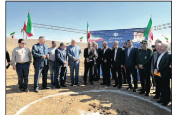
رستم قاسمی وزیر راه و شهرسازی

وزیر راه و شهرسازی فارس بیان کرد که در حال حاضر حدود ۱۴ پروژه به فضا، چهارم به لار، شیراز به چهرم، محور قدیم فسا به داراب، زرقان به قلات خان و زینان، زین دشت به دولت آباد، کارزون به حاجی آباد و دالین به نورآباد را از جمله آنها ذکر و خاطرنشان کرد که تا پایان اسفند به بهره‌برداری می‌رسند.